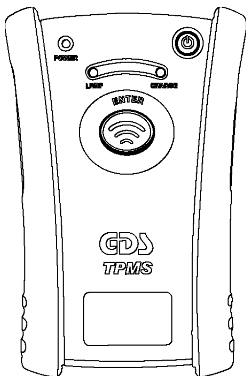
Module de TPMS